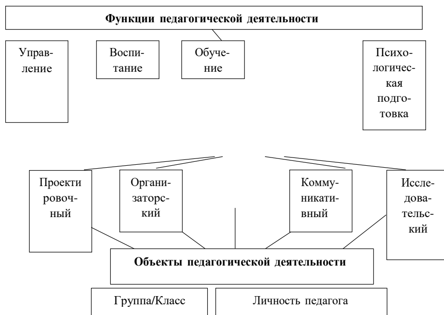
Схема 2. Педагогическая деятельность как общественное явление